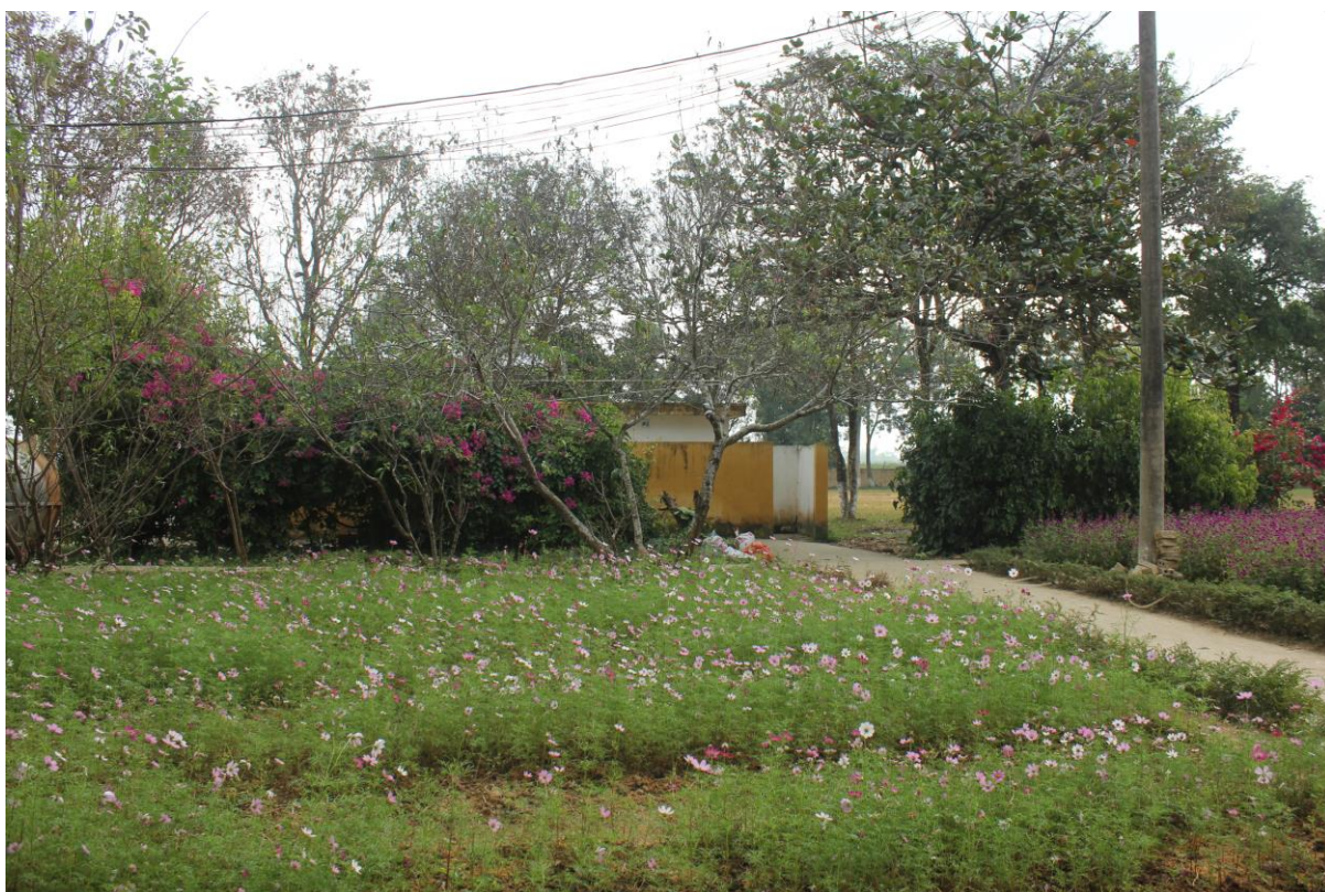
* Thu gom rác thải: Mã minh chứng (H3-3.4-02)