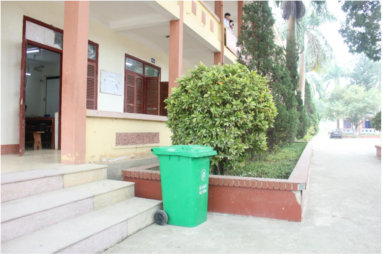
+ Thùng thu gom rác nhà C: Mã minh chứng (H3-3.4-02)