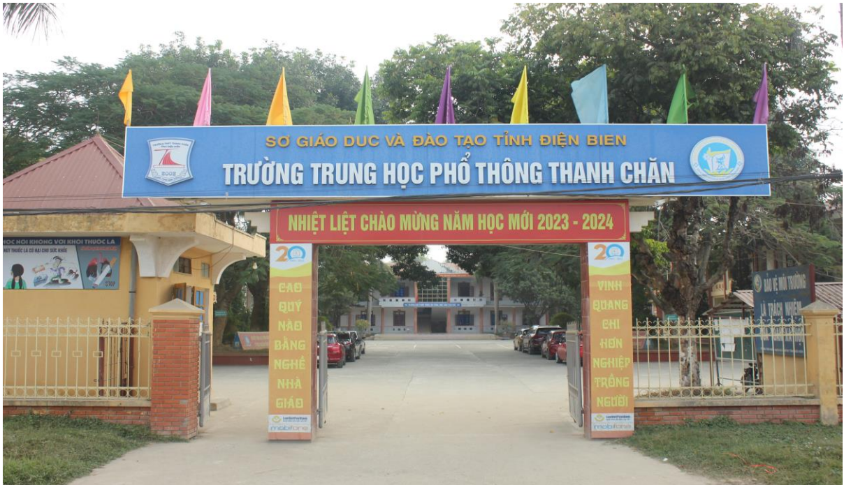
* Hình ảnh cổng trường: Mã minh chứng (H3-3.1-03)