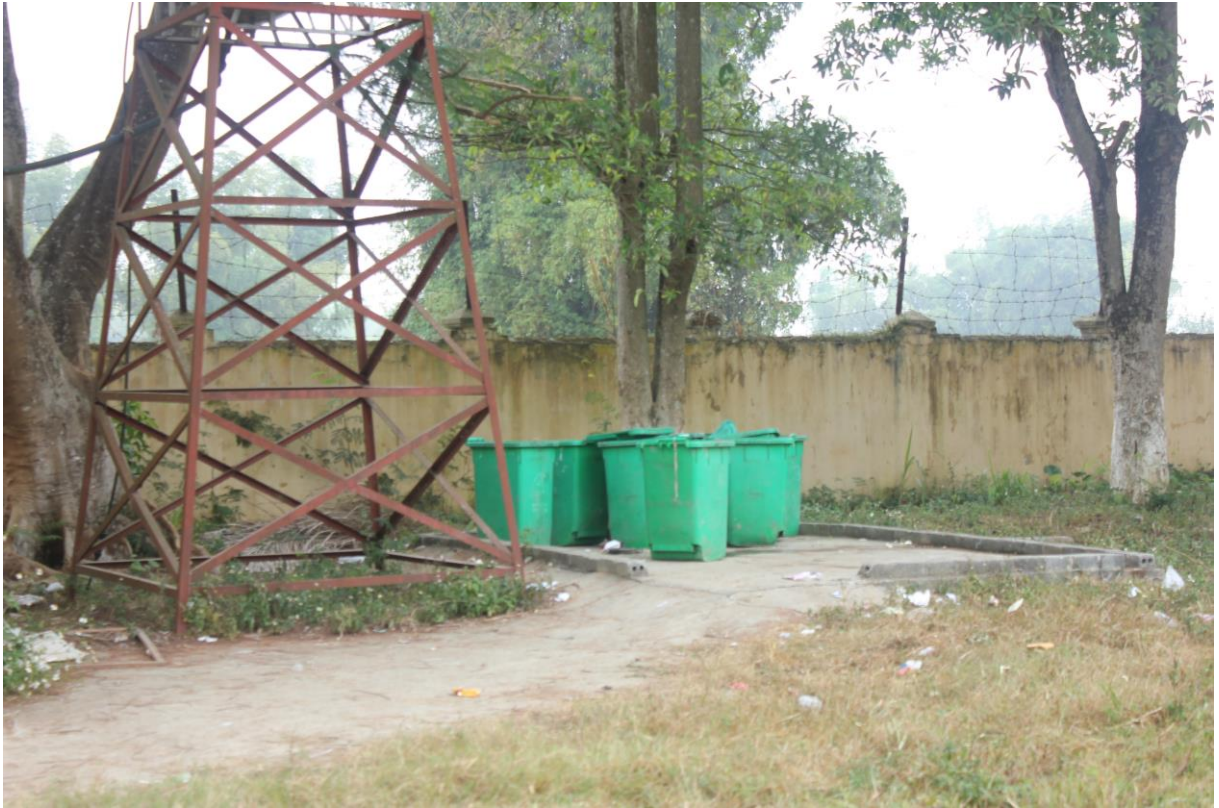
+ Thùng thu gom rác nhà A: Mã minh chứng (H3-3.4-02)